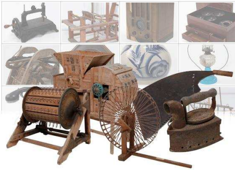
本山町歴史民俗資料