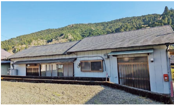
▲お試し滞在住宅（上街）