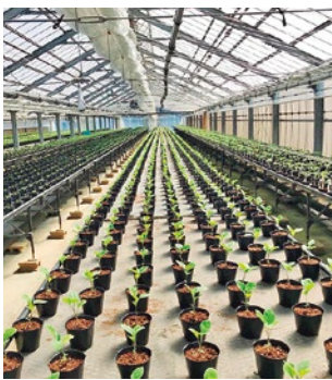
▲本山町種苗センター

設置目的及び指定管理者が行う業務を見直すため、条例の一部を改正するもの。 (全会一致可決)