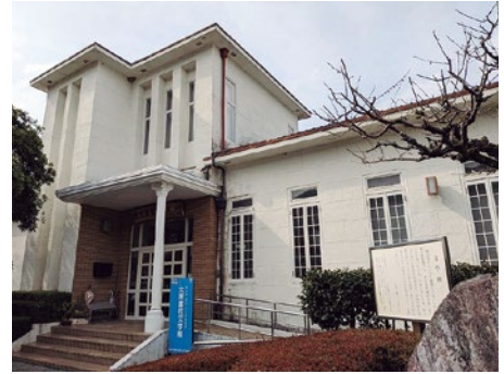
▲耐震化が急がれる文学館