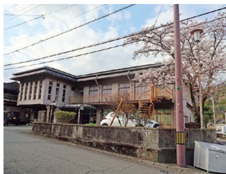
▲外観の改善を求める

答 ①大原文学館は文化財ではないが重要な歴史的建造物であると評価をいただいております。活用しながら残したいと考えています。耐震補強が可能かどうか具体的に診断を受けたことがないので可能であれば、どういう耐震補強ができるか専門家に相談していきたい。 ②落下物があり、敷地内を通行止めとしていたが、早期に調査を行い、対応していきたい。外装はできるところは改善していく。