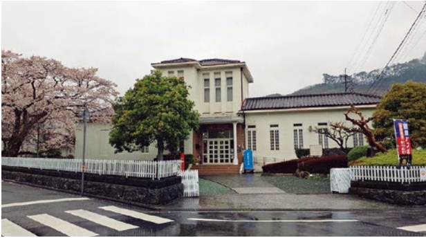
▲大原文学館 早急な安全対策を

答 文学館が耐震補強可能かどうか8年度中に専門家の診断を受けたい。安全対策は十分考えていきたい。教育施設運営等検討委員会では令和8年3月末に答申予定。 WiFiは整備を予定している。