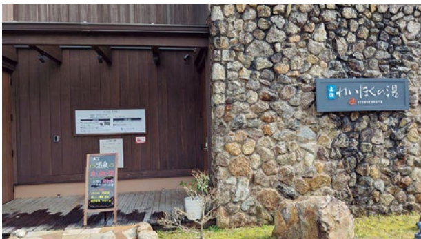
▲みんなで行こう！土佐れいほくの湯

答 昨年11月に天然鉱石の光明石を設置したことで利用者も増え、大変好評である。折り畳み式ベッド、またウォーターサーバーの設置の方法等、令和8年度に指定管理者と調整をしながら進めたい。