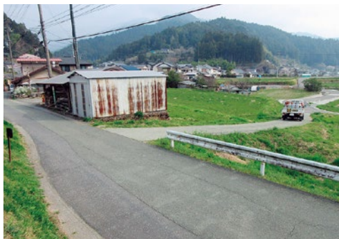
▲上関地区 工事用迂回路接続道

国・県との協議を行いな がら、事業効果、交通安全 面、財政面も総合的に勘案 し、適切な整備内容を判断 したい。