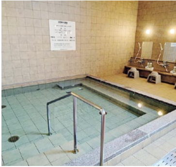
▲光明石を使った人工温泉(土佐れいほくの湯)

問 温浴施設の利用料を値上げする考えはないか。 答 昨年光明石を入れて利用者が増加している。そういった利用客を増やす新しい取組みをしているので、現時点では値上げは考えていない。