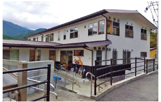
▲れいほく教育魅力化・交流支援センター

している法人、公共団体及び公共的団体若しくは住民で組織する団体（次項において「公的団体等」という。）を、第2条の規定による公募によらない指定管理者の候補者として選定することができ る。 （1） 第3条の規定による申請がなかった場合 （2） 前条各号のいずれにも該当することがなかった場合 （3） 公の施設の性格、規模及び機能等を考慮し、地域等の活力を積極的に活用した管理を行うことにより、事業効果が相当程度期待できる場合 2 前項の規定により選定するときは、町長は、当該公的団体等と協議し、第3条各号の書類の提出を求め、前条各号に照らし総合的に判断を行うものとする。