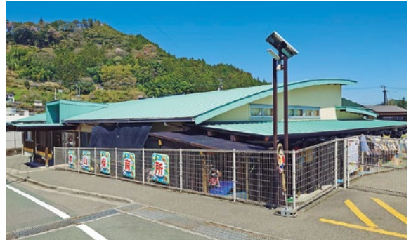
▲新たな制度が始まる（本山保育所）

問 本山保育所の乳幼児の避難体制を考えると今の職員体制は必要だが、3月で卒園生が21名、令和5年、6年の出生数を考慮すると、新制度（こども誰でも通園制度）の導入により新たに雇用する必要がないのではないか。