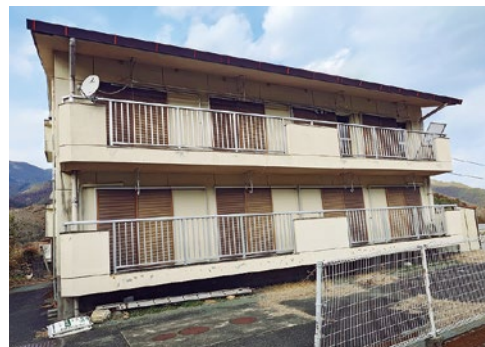
▲中間管理住宅予定物件

りで計上しただけで上乗せがない。 問 隣町では上乗せして補助金を出しており、熱心度と取組み度が違う。 答 県の補助だけではなく町の補助も上乗せし、普及を進めるべきではないか。 答 隣町は加速化交付金を活用して事業を行っているが、この事業は令和7年度で終了している。 関係機関と代わりになるような事業がないか相談をしており、今後検討していきたい。