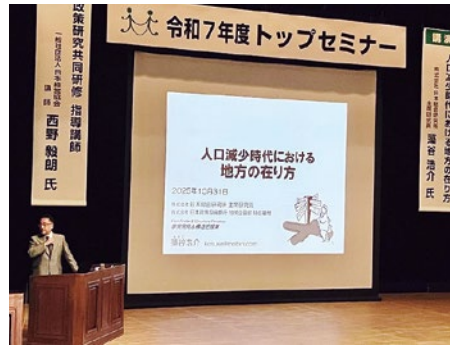
▲議員研修の様子(令和7年度トップセミナー)