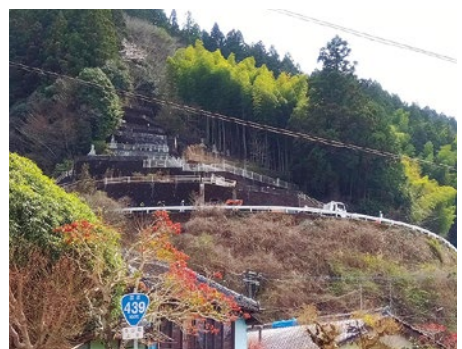
▲地すべりが危惧される急傾斜地(西谷地区)

問 五区西谷地区の急傾斜地帯に地滑りの危険性があると聞く。国・県に調査を要請し、対策を講ずるべき