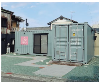
▲チャレンジャー求む

答 現在起業までにはつながっていないが、各種のイベントに参加している。コンテナハウスはキャパの問題があり今利用されていない。店舗の区画は数件問い合わせがある。