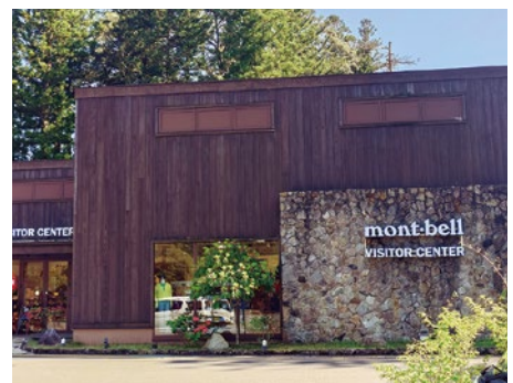
▲長期の指定管理が望まれる

問 ①「指定管理の運用状況に関する実態調査」(総務省行政評価局令和5年4月)によると当町のアウトドアヴィレッジでの集客力は人数面でも、人口比でも際立っている。町で必要な施設は議会に諮って長期的な指定管理期間を設定すべきでは。 答 ①条例に基づき研究等を行う。 ②他自治体の条例等を研究する。