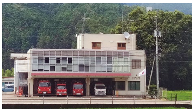
▲老朽化している消防庁舎

考えていかなければならない状況にきているが、消防職員を確保する面から基準を満たしていない仮眠室の改修は早急に解決しなければならぬという話になった。