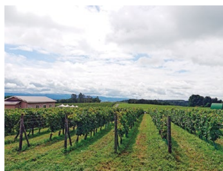
▲日本一の耕作面積のブドウ畑（浦臼町）