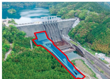
完成予想図（赤で囲んだ部分が増設放流設備です）