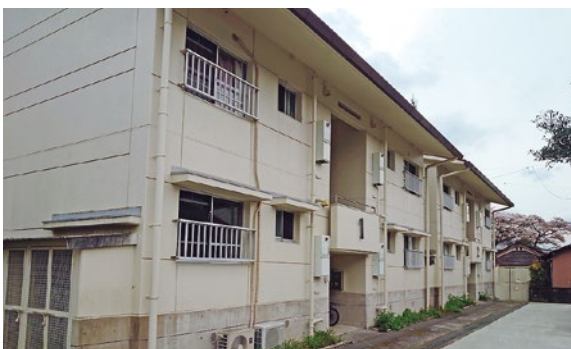
▲移住定住促進住宅（天神前）