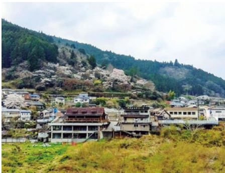
▲観光の復活で町の活性化を

② アウトドアヴィレッジ本山への7万人の来訪者をいかにまちなかに呼び込むかの取り組みによって、町内全域への波及効果に導くことを考えている。