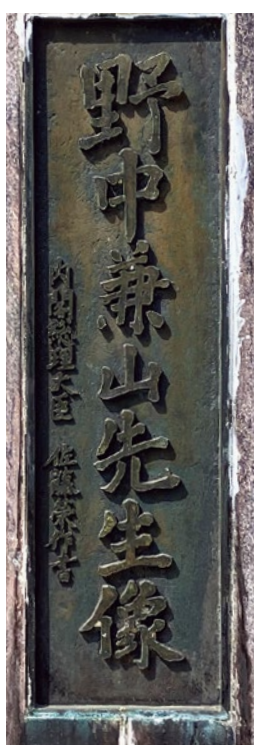
▲佐藤元総理による揮毫