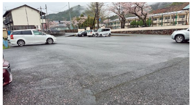
▲地下埋設型トイレ設置予定地(旧スポーツセンター跡)

問 ①避難所は生命と健康を守る場である。空調整備の現状と計画、優先順位は。 ②停電時の電力確保策として発電機や燃料、再エネ活用の状況は。 ③災害時の衛生確保として地下埋設型トイレの整備内容と運用体制は。