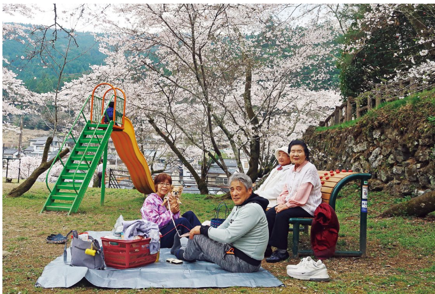
満開の桜の下で「ハイポーズ」(上街公園)