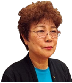
なかやま ゆり 中山百合 議員