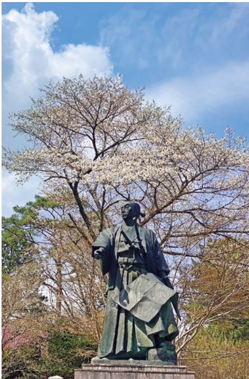
▲満開の桜と野中兼山像

職員が安心して職務に専念できる環境を守り、町民からの信頼を確保するためにも、本陳情の趣旨は妥当であると考える。