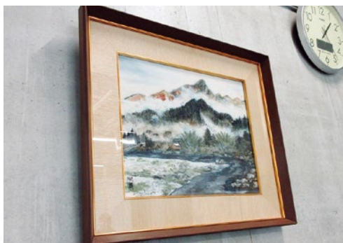
▲地元画家の作品（役場3階設置）