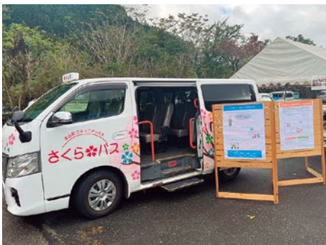
▲産業文化祭でのさくらバス展示の様子

本委員会として高齢社会、交通弱者に対し、さくらバスと路線バスの連携強化で持続的な交通運行体制及び利便性を考え、更なる交通網の検討を求めていくとした。