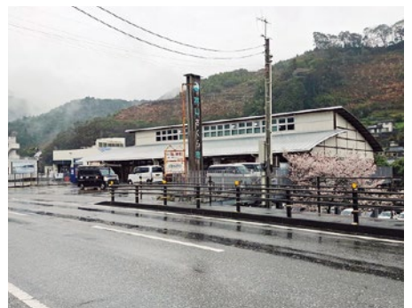
▲さくら市 さらなる活性化を

答 エネルギー価格や食料価格の上昇など構造的な課題に対しては町だけでは対応できない。 今後の国の動向を注視し、国の制度や交付金を活用し住民生活への影響を軽減したい。