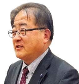
よしかわゆうぞう 議員 吉川裕三