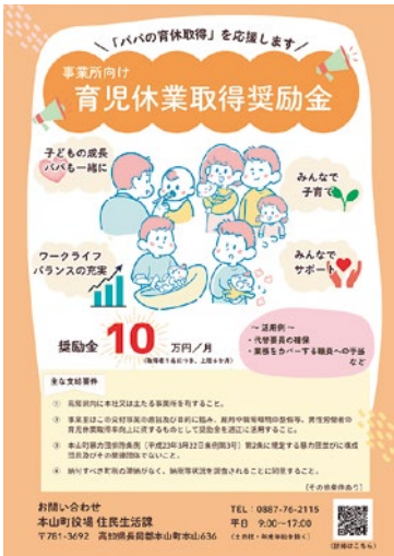
▲男性育休取得促進事業チラシ