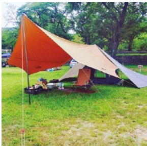
趣味のソロキャンプ