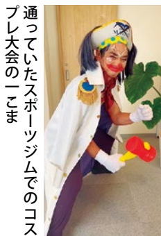
通っていたスポーツジムでのコスプレ大会のこま